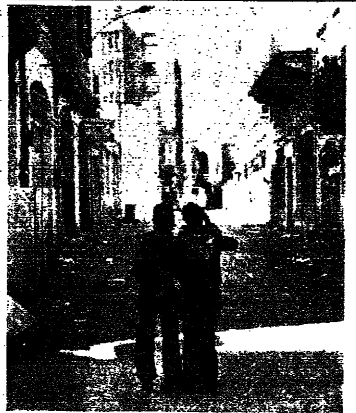
... تم بوجهه في الجوارق - تنمة

تفسير القرآن المشوّن الى طلاب المدرسة اجات ذرية، روحية، تشوّل، فرائد، حديد، الفل، تشوّل، التكمية